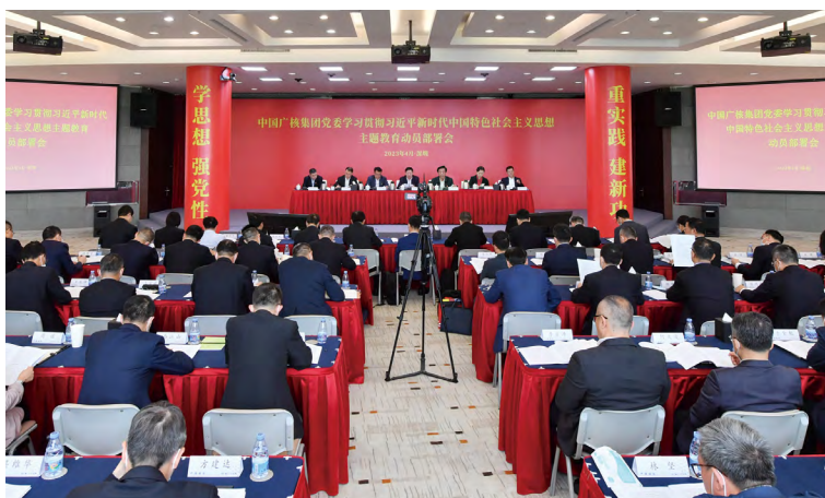
▲中广核召开学习贯彻习近平新时代中国特色社会主义思想主题教育动员部署会

落实主体责任。落实党中央《关于新时代加强和改进思想政治工作的意见》和国务院国资委党委《关于新时代加强和改进中央企业思想政治工作的实施意见》，中广核党委建立健全思想政治工作责