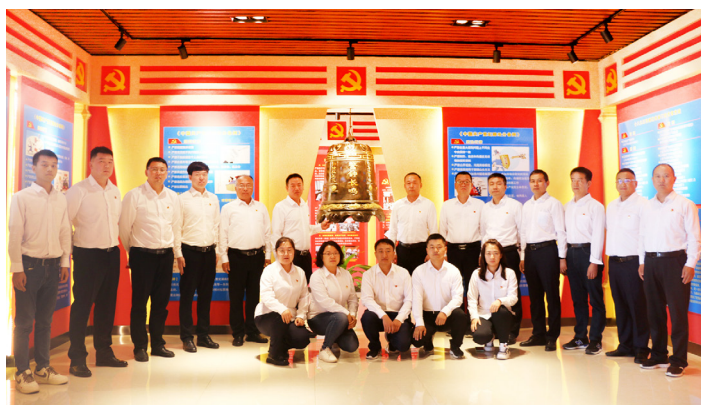
▲华电陕西公司纪委常态化开展警示教育

习近平总书记在全国国有企业党的建设工作会议上强调：“要把思想政治工作作为企业党组织一项经常性、基础性工作来抓。”华电陕西能源有限公司（以下简称“华电陕西公司”）党委在积极响应国家“双碳”目标、全面推进企业转型升级的过程中，认真学习贯彻落实习近平总书记关于思想政治工作的重要论述和重要指示批示精神，不断加强改进思想政治工作，为企业生产经营、改革发展注入了强劲的精神动力。