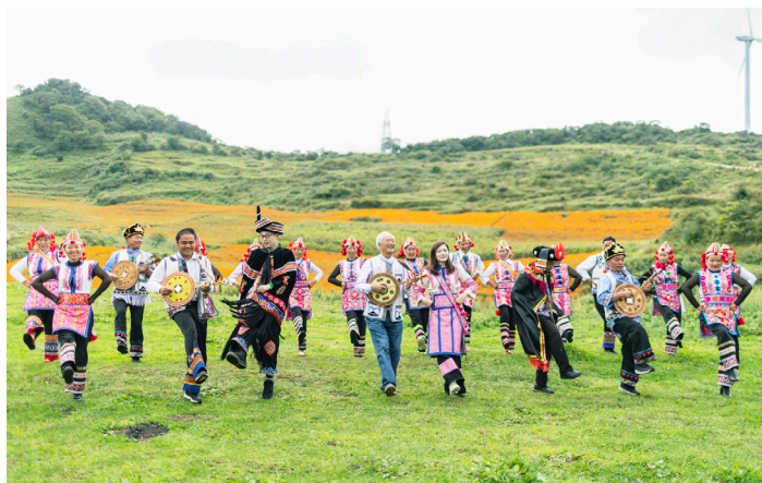
▲公司与云南省出水寨村结对开展文化扶助活动

公司党委以“践行初心、担当使命”要求为指引，坚守主业发展阵地，遵循上海市国资委“牢记使命、深化改革、守正创新、服务发展”的核心价值观，致力于让资本成为推动社会进步的力量。公司近五年利润总额124亿元，年人均创利1700万元。以“改革开放精神”为指引，做到五个“坚